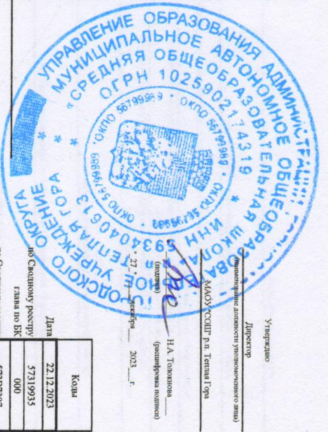
Приложение 1. Поступления и выплаты